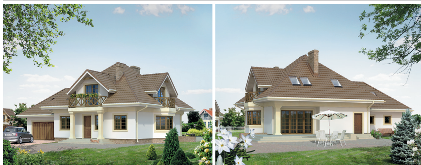
WILGA 4 z piwnicą – P.U. 155,4 m 2 + garaż i piwnica